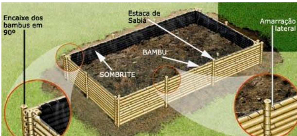
Figura 2 - A montagem do minhocário de bambu proposta pela EMBRAPA