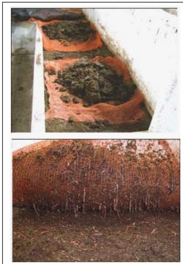
Figura 6. Isca com estrume (Circular Técnica EMBRAPA)

cópia física em papel que ficou de posse do LEPAC e uma para cada parte envolvida.