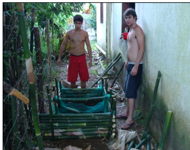
Figura 3 – Minhocário Campeiro construído no LEPAC, em fevereiro de 2011.

fundo e as laterais com sombrite. Passamos o arame em ziguezague "costurando" as bordas da tela aos bambus superiores das paredes do minhocário. Cortamos as sobras de tela com uma tesoura. Enchemos um quarto canteiro com terra, e então colocamos uma tela. Mais 1/8 do canteiro de terra e cerca de 150 minhocas. Tornando-se apto a receber o lixo orgânico. É importante que o material seja mantido sempre úmido (Figura 3).