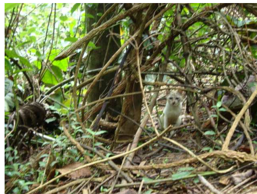
Figura 5: Gato feral encontrado na trilha na Ilha do Araújo-RJ.

tenha dificuldades em manter sua população pela alta taxa de predação.