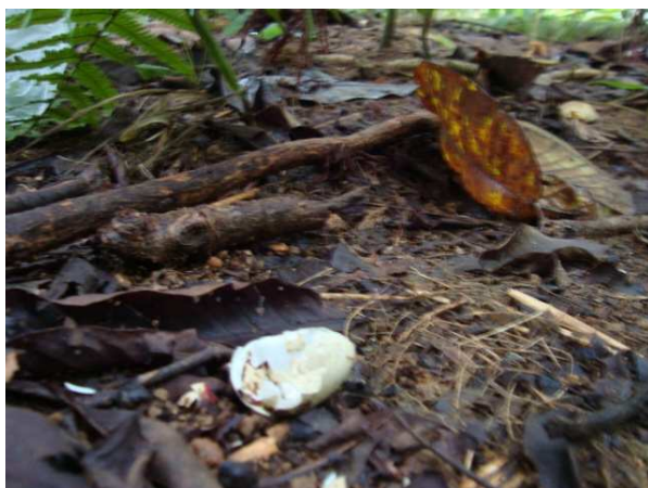
Figura 4: Casca de ovo predado encontrada longe do ninho na Ilha do Araújo-RJ.

Já no continente nenhum ninho aéreo foi predado, e apenas em quatro ninhos no chão os ovos desapareceram (44%, Figura 3). Nestes, novamente havia pegadas de cachorro doméstico. Foram avistados gatos e cães domésticos durante toda a trilha na Ilha do Araújo (Figura 5).