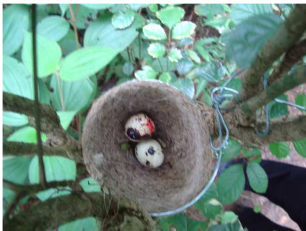
Figura 2: Ninho aéreo na Ilha do Araújo, Paraty-RJ.

Foram apresentados dois ovos de codorna de aproximadamente 25 a 30 mm de comprimento, sendo um deles cru e o outro cozido, com a finalidade de identificar os predadores que poderiam deixar cicatrizes nos ovos predados, em substituição aos ovos sintéticos ou de massa de modelar. Estes que podem representar os ovos naturais no formato, tamanho e na cor, entretanto o seu odor e a sua consistência podem influenciar na predação de pequenos mamíferos (Maier; DeGraaf, 2001).