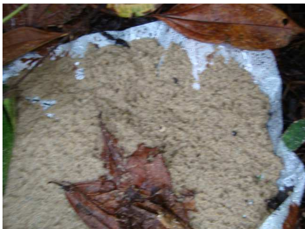
Figura 1: Ninho no chão na Ilha do Araújo, Paraty-RJ.

Os ninhos no sub-bosque foram comprados e apresentam 9 cm de diâmetro e 4 cm de profundidade, e foram amarrados com arame nos arbustos (Figura 2).